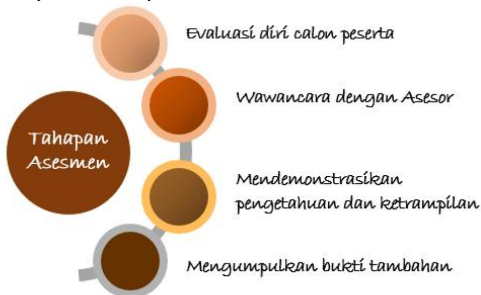
Gambar 2: Tahapan Asesmen RPL

Dokumen dokumen portofolio ( Bukti ) untuk mendukung klaim calon atas pernyataan kriteria capaian pembelajaran mata kuliah atau modul pembelajaran yang dilampirkan calon pada saat mengajukan lamaran akan diverifikasi dan divalidasi oleh Asesor sesuai prinsip bukti, yaitu, sah, cukup, terkini dan otentik.